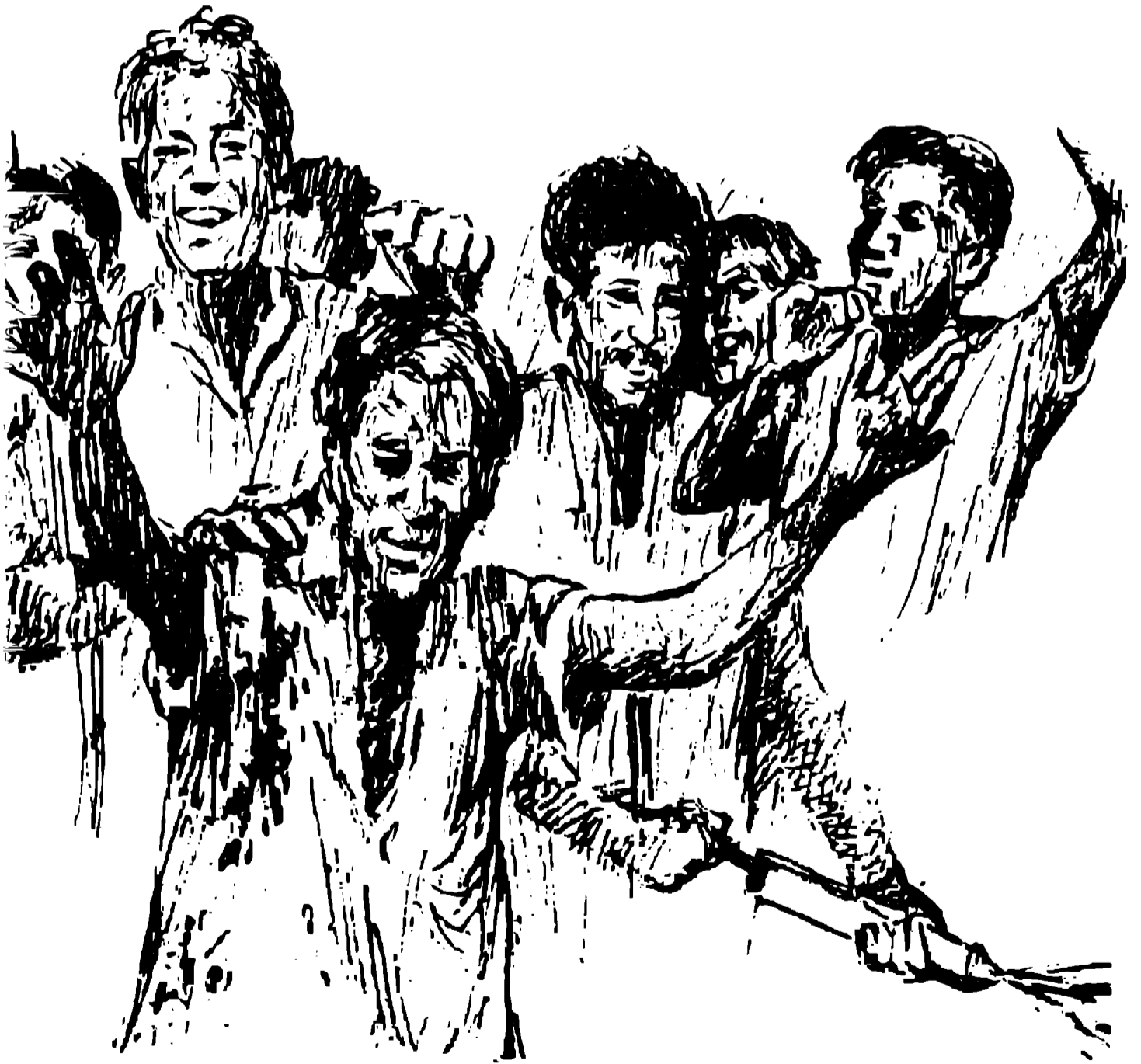
चित्र : होली मनाते लोग

होली मस्ती और राग रंग का पर्व है। यह फाल्गुन के अंत अर्थात् फरवरी-मार्च में मनाई जाती है। होली का त्योहार जाड़े का मौसम खत्म होने और गर्मी के मौसम प्रारंभ होने की घोषणा होता है। उन दिनों गेहूं की बालियां पीली पड़ने लगती हैं। और किसान की मेहनत